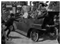
斐迪南大公夫妇遇刺

[思考] (1)材料一表中反映了什么基本现象?这一现象的出现主要取决于什么?它对世界局势产生了怎样的影响?